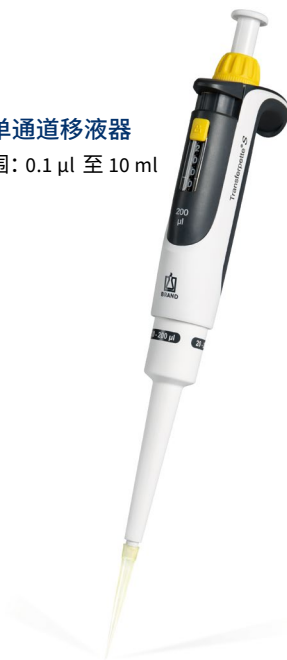
Transferpette® S - 单通道移液器 单通道移液器量程范围: 0.1 µl 至 10 ml